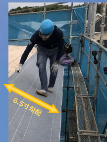
急勾配の作業でも高評価