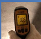
ベタつき確認試験 製品表面温度 80℃